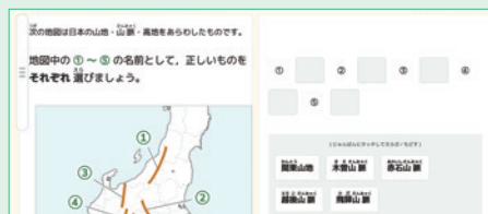
日本の地名 | 山地の例