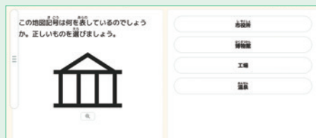
地図の見方 | 地図記号の例

授業中の取り扱いが難しい「地図の見方」、「日本の地名」、「世界の地名」。プリント作成や採点の手間をかけず、繰り返し問題が解けるキュビナで地理の基礎となる知識・技能の定着を目指しましょう。