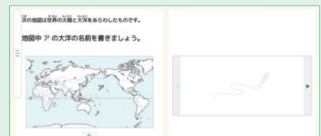
世界の地名 | 大陸と大洋の例