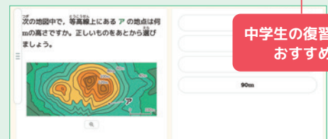
地図の見方 | 等高線の例